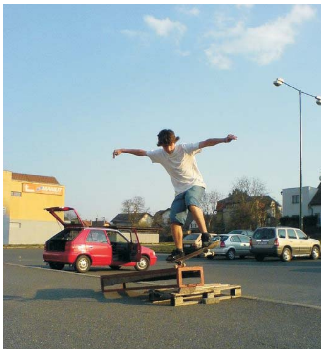
Budou muset být dále na náměstí Svobody?